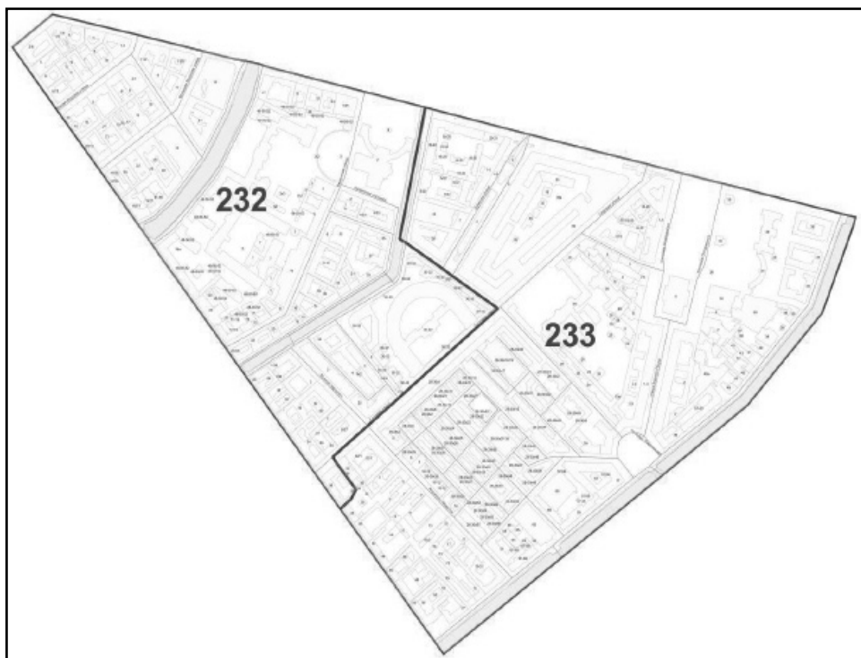
Схема многомандатных избирательных округов для проведения выборов депутатов Муниципального Совета Внутригородского Муниципального образования города федерального значения Санкт-Петербурга муниципального округа № 78

Приложение № 2 к решению МС МО МО № 78 от 07.09.2023 № 19